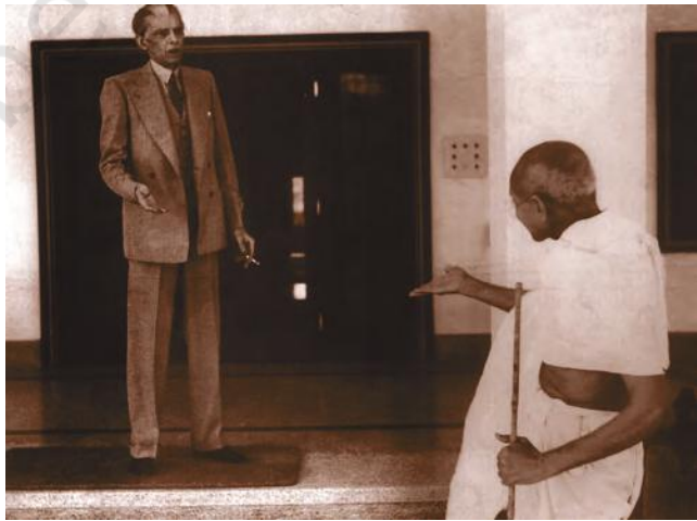
जिन्ना और गांधी

जिसे सांप्रदायिक समस्या कहा जाता था, वह अल्पसंख्यकों के अधिकारों के साथ इस तरह तालमेल बैठाना था ताकि उन्हें बहुसंख्यकों के खिलाफ़ पर्याप्त संरक्षण मिल सके। भारत के अल्पसंख्यक यूरोप की तरह जातीय या राष्ट्रीय अल्पसंख्यक नहीं, वे धार्मिक अल्पसंख्यक हैं। जातीय दृष्टि से भारत में एक विचित्र मिश्रण है, पर जातीय सवाल भारत में न कभी उठे हैं न उठ सकते हैं। धर्म इन जातीय विभिन्नताओं के ऊपर है। जातियाँ या तो एक दूसरे में मिल जाती हैं या उनमें अंतर करना कठिन होता है। ज़ाहिर है कि धार्मिक दीवारें स्थायी नहीं होतीं और जो व्यक्ति अपना धर्म बदलता है उसकी जातीय पृष्ठभूमि या उसकी जातीय और भाषिक विरासत नष्ट नहीं हो जाती। परंतु राजनीतिक मामलों में, धर्म का स्थान सांप्रदायिकता ने ले लिया है। यह एक संकीर्ण समुदाय