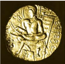
समुद्रगुप्त वीणा बजाते हुए—एक सिक्का

नहीं तोड़ा बल्कि उसके सांस्कृतिक आदर्शों और सामाजिक ढाँचे के लिए भी खतरा पैदा कर दिया। इनके विरुद्ध जो प्रतिक्रिया हुई उसका रूप मूलतः राष्ट्रवादी था। उसमें राष्ट्रवाद की शक्ति भी थी और संकीर्णता भी। धर्म और दर्शन, इतिहास और परंपरा, रीति-रिवाज और सामाजिक ढाँचा, जिसके व्यापक घेरे में उस समय के भारत के जीवन के सभी पहलू आते थे, जिसे ब्राह्मणवाद या हिंदूवाद कहा गया, वह इस राष्ट्रवाद का प्रतीक बना। यह दरअसल राष्ट्रीय धर्म था, जिससे वे तमाम गहरी जातीय और सांस्कृतिक प्रवृत्तियाँ प्रभावित हुईं जो आज हर जगह राष्ट्रीयता की बुनियाद में मौजूद हैं। जिस बौद्ध धर्म का जन्म भारतीय विचार से हुआ था, उसके लिए भारत वह पुण्य भूमि थी जहाँ बुद्ध ने जन्म लिया, उपदेश दिया और वहीं उनका निर्वाण हुआ। पर बौद्ध धर्म मूल रूप में अंतरराष्ट्रीय था, विश्वधर्म था। जैसे-जैसे उसका विकास और विस्तार हुआ वैसे-वैसे उसका यह रूप और विकसित होता गया। इसलिए पुराने ब्राह्मण धर्म के लिए स्वाभाविक था कि वह बार-बार राष्ट्रीय पुनर्जागरण का प्रतीक बने।