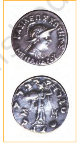
हिंद-यूनानी शासक मेनांडर का एक सिक्का

मध्य-एशिया में शक (सीदियन) लोग ऑक्सस (अक्षु) नदी की घाटी में बस गए थे। यूइ-ची सुदूर पूरब से आए और उन्होंने इन लोगों को उत्तर-भारत की ओर धकेल दिया। ये शक बौद्ध और हिंदू हो गए। यूइ-चियों में से एक दल कुषाणों का था। उन्होंने सब पर अधिकार करके उत्तर-भारत