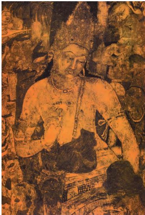
अजंता का एक चित्र

सातवीं-आठवीं शताब्दियों में ठोस चट्टान को काटकर एलोरा की विशाल गुफाएँ तैयार हुईं, जिनके बीच में कैलाश का विशाल मंदिर है। यह अनुमान करना कठिन है कि इंसान ने इसकी कल्पना कैसे की होगी या कल्पना करने के बाद अपनी कल्पना को रूपाकार कैसे दिया होगा। एलीफेंटा की गुफाएँ भी इसी समय की हैं जहाँ प्रभावशाली और रहस्यमयी त्रिमूर्ति बनी है। दक्षिण भारत में महाबलीपुरम् की इमारतों का निर्माण भी इसी समय हुआ था।