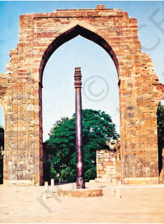
महरौली (दिल्ली) में कुतुबमीनार के परिसर में खड़ा लौह-स्तंभ, जिसका निर्माण लगभग 1500 साल पहले हुआ

जाता था। भारतीय रेशम उद्योग ने बाद में विकास किया, लेकिन बहुत नहीं। कपड़े को रँगने की कला में उल्लेखनीय प्रगति हुई और पक्के रंग तैयार करने के खास तरीके खोज निकाले गए। इनमें से एक नील का रंग था, जिसे अंग्रेज़ी में 'इंडिगो' कहते हैं। यह शब्द इंडिया से बना है और अंग्रेज़ी में यूनान के माध्यम से आया है।